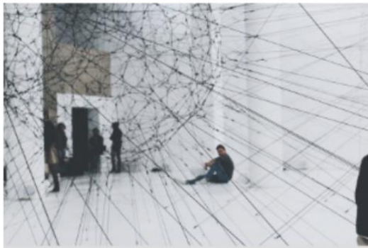
Mínor en Creació i Pràctica Cultural