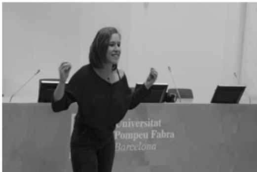
Mínor en Oratòria