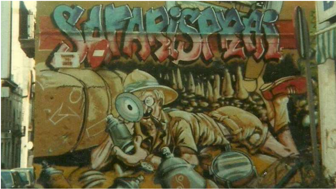
SafariSprai, grafit pintat el 1988, actualment desaparegut.